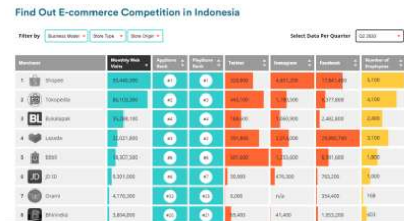
Gambar 1. Pengguna E-Commerce Pada Kuartal 2 Tahun 2022

Masa keemasan e-commerce telah dimulai di Indonesia, saat ini masyarakat lebih memilih membeli apapun melalui e-commerce . Tahun 2020 adalah tahun yang transformatif untuk pelaku e-commerce , karena masyarakat diharuskan mengikuti regulasi social distancing dan beraktivitas di rumah. Sehingga masyarakat beralih ke platform online untuk membeli kebutuhan sehari-hari, dengan pembelian secara online konsumen tidak perlu keluar rumah untuk membeli kebutuhan sehari-hari dan barang akan diantarkan sampai rumah. Proses pembayaran juga bisa dengan berbagai pilihan, dapat dilakukan dengan pembayaran tunai pada saat barang yang dibeli datang atau pembayaran digital yang sudah disediakan oleh e-commerce . Pengguna e-commerce juga meningkat dari tahun 2020 sampai 2021, dapat dilihat dari Gambar 1 dan Gambar 2: